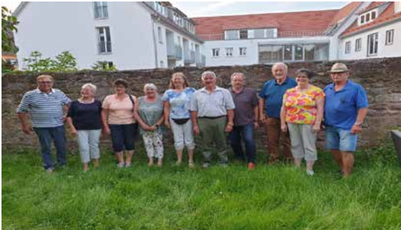
Die neue Vorstandschaft stellt sich vor

Bei der Jahreshauptversammlung am 23. Juli 2021 wurde eine neue Vorstandschaft gewählt.