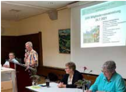
Mitgliederversammlung am 26. Juli 2021