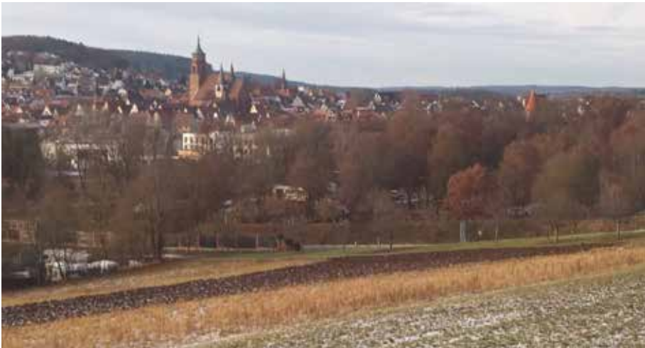
Blick auf Weil der Stadt

Rückblick auf das zurückliegende Jahr sowie die Vorschau der Ortsvereine und des Kreisverbandes auf 2022.