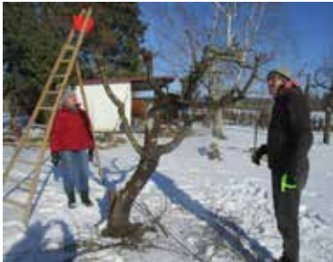
Winterschnittkurs im OGV-Vereinsgarten