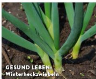
GESUND LEBEN: Winterheckzwiebeln