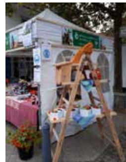
OGV-Stand auf dem Herrenberger Wochenmarkt