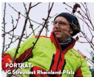
PORTRÄT: MIG Streuobst Rheinland-Pfalz