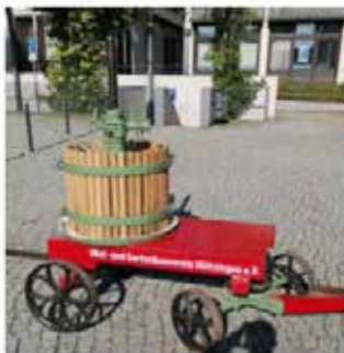
Restaurierte Historische Presse bei der Veranstaltung Schaumosten